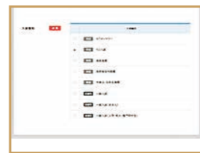
入試種別選択 AO入試、公募推薦入試、一般入試、留学生入試など、入試種別を選択。