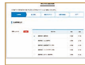
学科・クラス選択 希望の学科を選択。