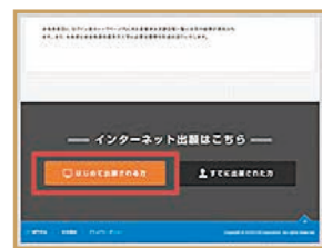
「初めて出願される方」のボタンをクリック。

ご注意ください 氏名で常用漢字以外の文字(例:高、柳、祐、崎、瀬など)を入力すると、検定料納入でエラーになります。常用漢字を当てるか、カタカナで入力しなおしてください。