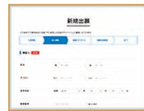
個人情報詳細入力 生年月日や学歴などを入力。