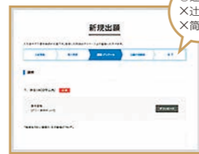
課題作文、質問項目入力 画面の指示に従って、課題作文や質問項目を入力(または選択)。