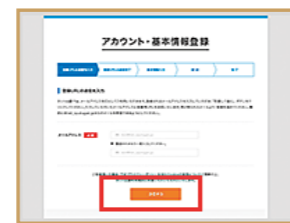
ネット出願アカウント作成ページへ進む。メールアドレスを入力して「送信する」をクリック。