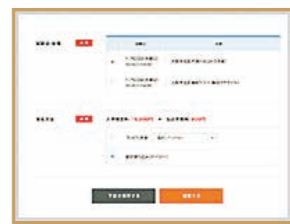
選考(随時)日・支払方法選択 1 コンビニ決済 2 銀行振込(ペイジー) 3 クレジット払い から支払方法を選択。