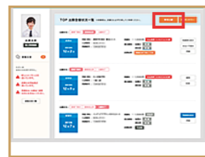
ログイン後、ページの「新規出願」ボタンをクリック。