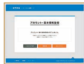
入力したメールアドレスに届く「ネット出願アカウント登録確認」メール内にある、確認用URLをクリックして登録を完了させる。