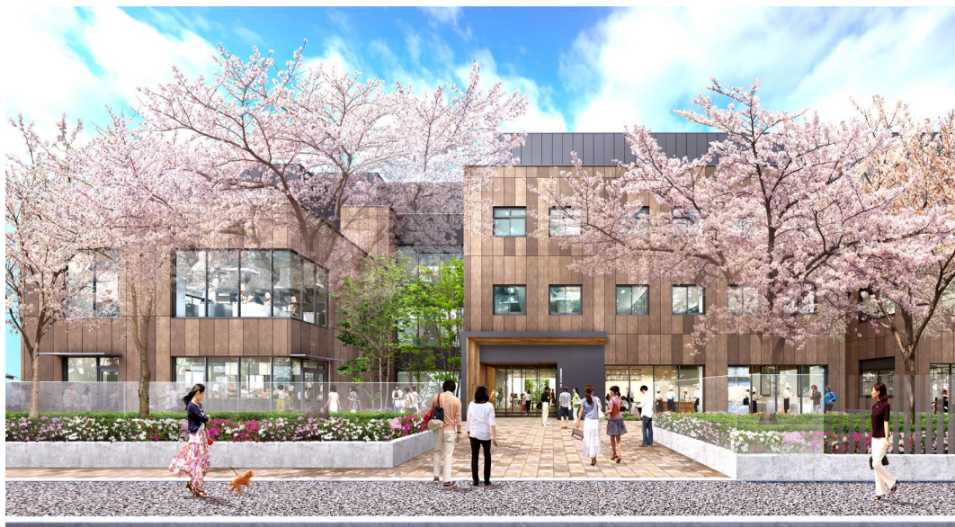
<校舎イメージ> 現在新校舎建設中。2023年7月竣工予定

学校法人辻料理学館は、1960年大阪に開校した「辻調理師学校」にはじまり、厚生労働大臣指定の専修学校「辻調理師専門学校」と「辻製菓専門学校」を運営してきました。また独自のカリキュラムを提供するグループ校と合わせて、これまで14万人以上の卒業生を輩出し、その多くが日本や世界各国の飲食業界で活躍しています。これまでの伝統と教育ノウハウを継承し、創立65年目の節目にあたる2024年4月に、新たに「辻調理師専門学校 東京」の開校を目指します。開校の地に選んだ東京都小金井市は、古くから続く都市農業の振興地域であり、本校が目指す学びを実践していくにあたり、最適なエリアであると考えています。また、隣接する国立大学法人東京学芸大学とも2022年に連携協定を締結し、「食と環境」をテーマに教育研究を深化させ、両校が培ってきた「知」を集結させて次代を見据えた学びを提供します。