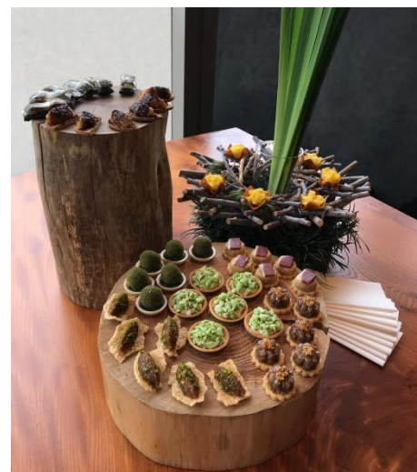
夕食会前のカクテルタイムで提供 すべて大阪産の食材を使用したフィンガーフード8種 テーマは「日本の八重奏(クオテット)」

また、サステナビリティという点においては、すべての食材に対して、「G-GAP」「MSC」といった国際規格を踏襲することは困難だったものの、畜産、水産、野菜の主食材において可能な限り調達ルートに配慮しました。